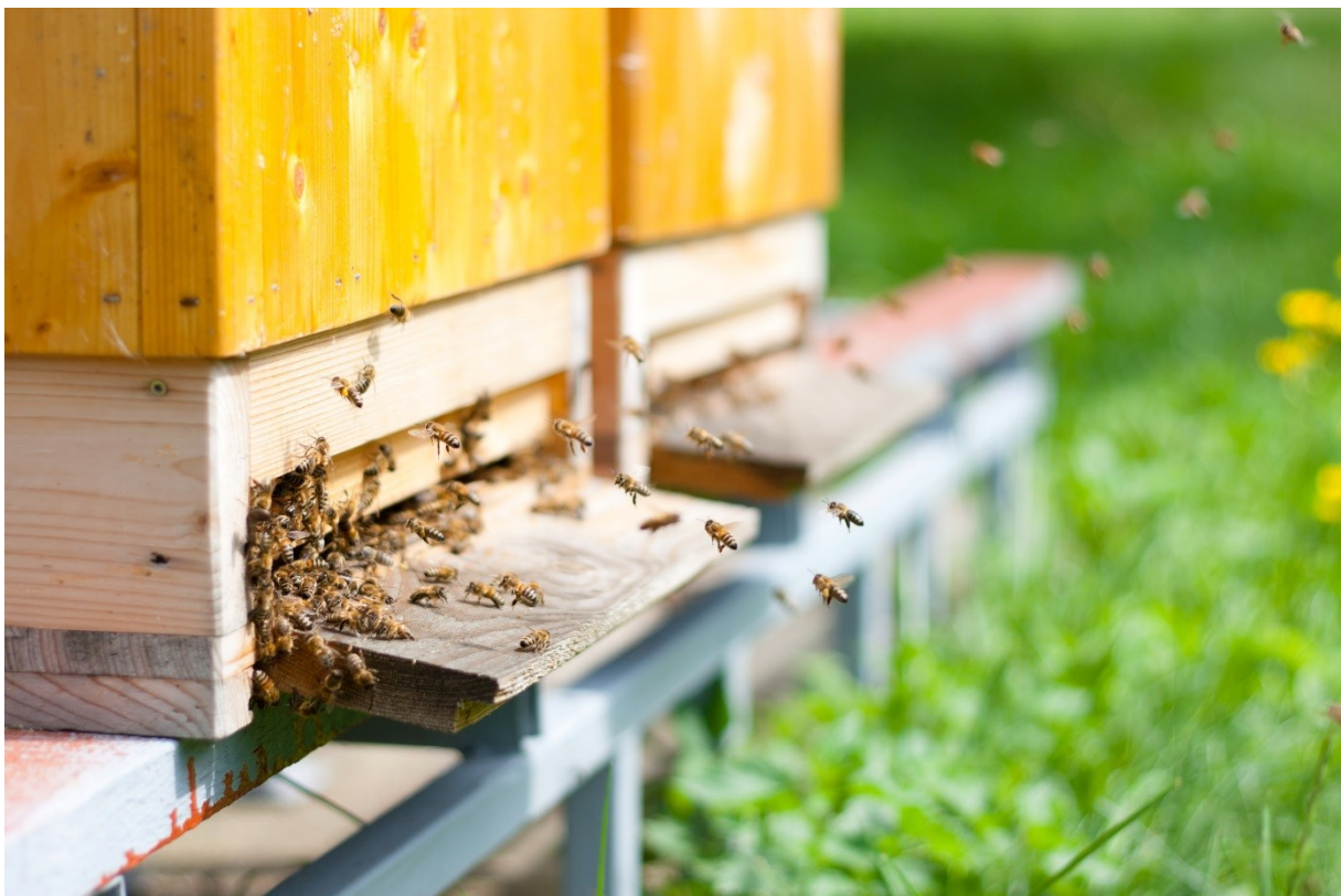
Abbildung II: Bis Honigbienen im Frühjahr wieder ausfliegen, können neun Monate Winterfütterung nötig sein. ii

Empfehlungen, die sich aus den genannten Anforderungen an Futtermittel für Honigbienen hinsichtlich der Herstellung, des Transports, des Handels und für den Imker ergeben, werden unter Punkt 4 aufgeführt.