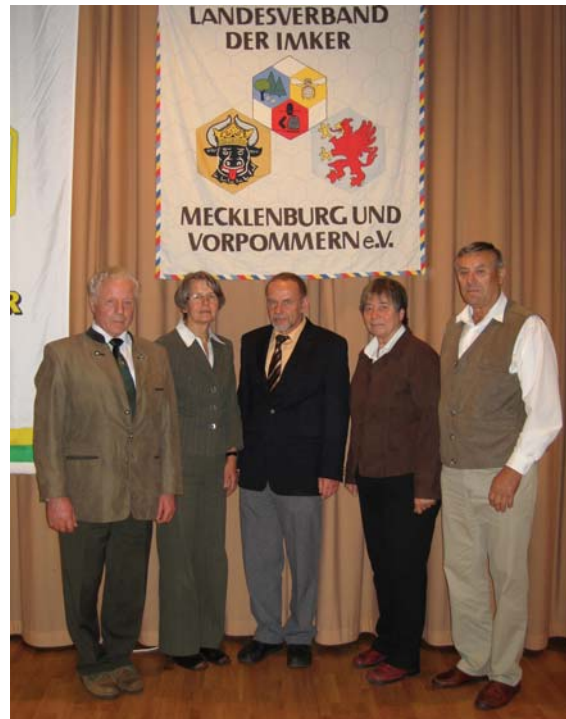
Die wieder gewählten Mitglieder des Vorstandes (von links):

In den Folgejahren entwickelte sich die sozialistische teils vom Staat gestützte Bienenhaltung auf dem Sektor der sowjetischen Besatzungszone (SBZ), die Vereine von Mecklenburg-Vorpommern wurden in den darauffolgenden Jahren in den VKSK (Verband der Kleingärtner, Siedler und Kleintierzüchter) integriert und umfas-