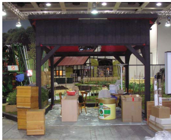
So sieht der D.I.B.-Stand einen Tag vor Beginn der Messe aus.

Messepreise: Tageskarte 12,- € Gruppenkarte 10,- € Happy Hour (ab 15 Uhr) 6,- € an Sonntagen 10,- €