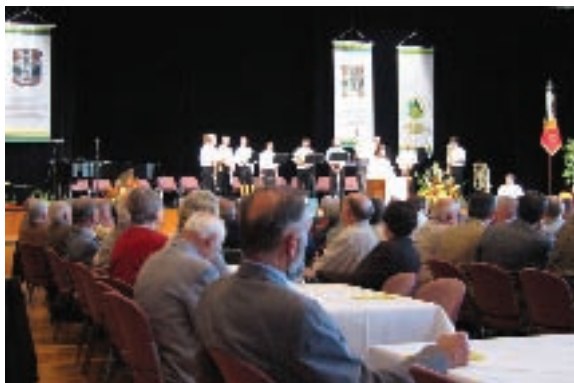
Gottesdienst am Sonntagmorgen