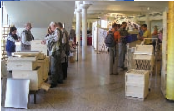
Ausstellung des Fachhandels im Erdgeschoss des "Forum am Schlosspark"