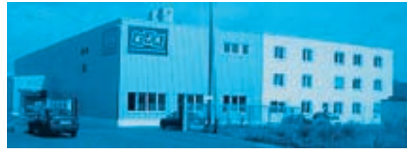
Edwin Jereb Kunststofftechnik GmbH in Aichach

Die Firma Jereb GmbH (EJK) überzeugte durch ihre Preisgestaltung und technischen Möglichkeiten.