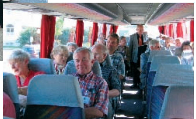
Ein Bus bringt die Imker in die alte Landeshauptstadt Bonn