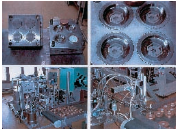
Werkzeug für die Deckelherstellung

Der Familienbetrieb Edwin Jereb Kunststofftechnik GmbH wurde 1988 in Indersdorf gegründet, siedelte 1993 nach Aichach über und befindet sich seit dem Jahr 2003 in neu gebauten Produktionshallen in Aichach-Ecknach, zwischen Augsburg und München gelegen. Mit den vorhandenen 14 Spritzgussmaschinen von 50 bis 800 Tonnen Schließkraft stellen die 30 Mitarbeiter/innen der Firma unter anderem Kunststoffteile für Automobile, Bettfedern, Leitsysteme, Transportkästen und Haushaltstechnik her.