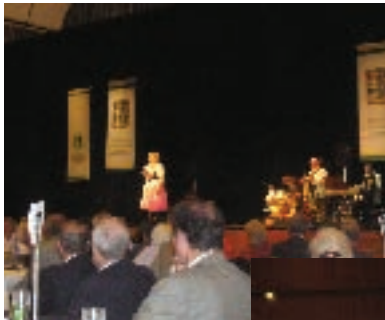
Ein bunter Mix aus Gesang, Akrobatik und Zauberei wurde den Besuchern geboten.