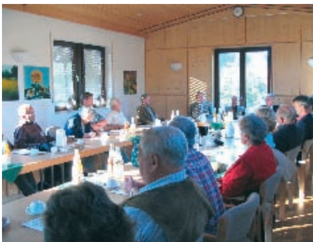
Während der Gespräche im Sitzungssaal des "Haus des Imkers"

Teilnehmerzahl von mehr als 3.000 Besuchern und lieferte ein attraktives Angebot an Vorträgen und Posterbeiträgen aus nahezu allen Bereichen der Bienenkunde und Imkerei. Art und Umfang der Ausstellung (Imkereitechnik und -produkte) waren im Vergleich zu früheren Kongressen schwächer ausgefallen.