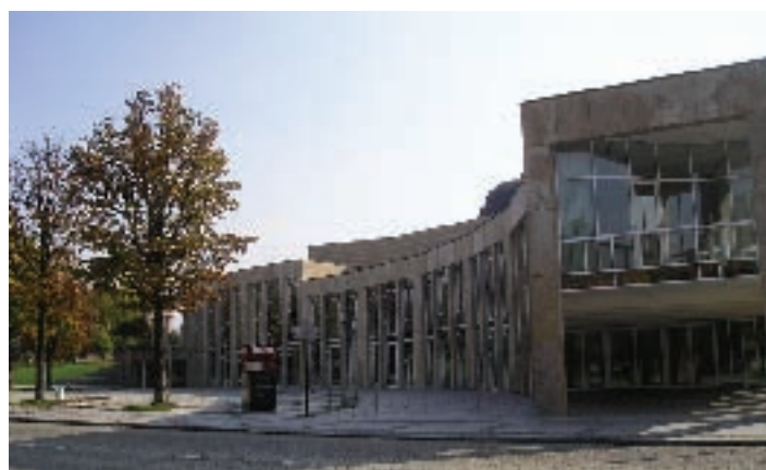
Alle Veranstaltungen fanden in einem würdigen Rahmen im Forum am Schlosspark statt.