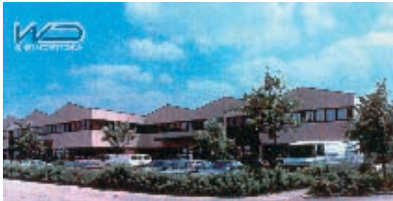
WD Kunststofftechnik GmbH in Günding

Heute stellen zwei Firmen die Deckel für das Imker-Honigglas her.