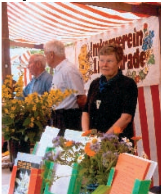
Die attraktiven Stände der beiden Imkervereine wurden zum Magnet.

"Wie in den Vorjahren hat der Imkerverein Lichtenrade zusammen mit dem Imkerverein Tempelhof den "Tag der deutschen Imkerei" gemeinsam ausgetragen. Aus gegebenem Anlass haben wir diesen Tag um eine Woche...vorgelegt. Grund war das an diesem Tag stattfindende Hafenfest der ufaFabrik, einem internationalen Kulturzentrum in Tempelhof. Dieses Fest ist für uns Imker eine besonders erfolgreiche Plattform, um unsere Anliegen an die Öffentlichkeit zu bringen. Aussteller aus allen Bereichen des Natur- und Umweltschutzes und ökologisch orientierter Organisationen geben sich dort ein Stelldichein. Insgesamt wurden auf dem Fest etwa 6.000 Besucher gezählt und unsere Crew war ständig von wissensdurstigen Besuchern umlagert.