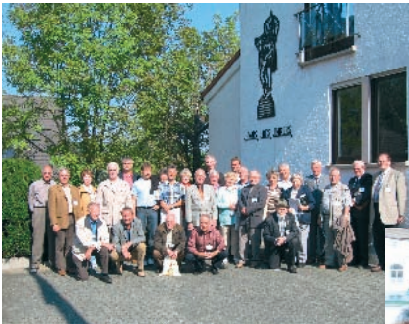
Die Vereinsvertreter vor dem "Haus des Imkers" in Wachtberg-Villip