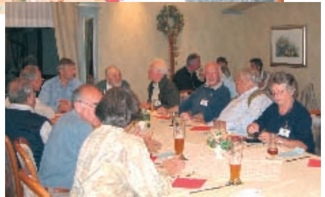
Am ersten Abend beim Imkertreff im Hotel "Görres"