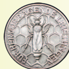
Medaille in Silber