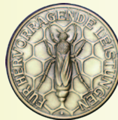
Medaille in Bronze