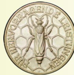
Medaille in Gold